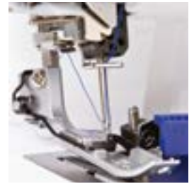
Automatische draadinvoer in de naald